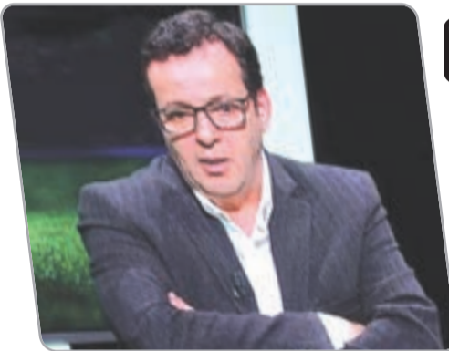
عمل في عديد الأندية على غرار اتحاد العاصمة وأهلي البرج وشبيبة القبائل.

عين، أمس، رئيس القاف وليد صادي نذير بوزناد أمينا عاما للاتحاد الجزائري لكرة القدم خلفا لمخير ديبشي الذي أنهيت مهامه، وقد تمت أمس عملية تسليم المهام بين الرجلين بمقر القاف.