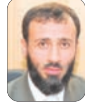
● بقلم: سلطان بركاني

مرّ اليوم العالمي للمعلم، على الجزائريين، من دون أن يلقي اهتماما كبيرا في الواقع ولا في المواقع.. فباستثناء بعض التهاني التي كتبها بعض الأوفياء لمعلميهم، لم نر تكريمات أقيمت في المدارس، ولا تغطيات إعلامية في مستوى المناسبة.. ولعل سبب هذا الفتور في التعامل مع الذكرى، هو تلك النظرة التي أصبح يحملها كثير من الجزائريين لمرّبي الأجيال، وهي نظرة مبنية على تعميم واقع لا يسر، انحدر إليه التعليم ويعيشه بعض المعلمين والأساتذة الذين تحوّل التدريس في حياتهم إلى مهنة مثل باقي المهن، يزاوئونها لكسب أرزاقهم.