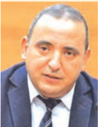
حريك رئيس لجنة المرفئة