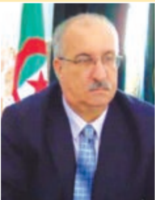
مدير جامعة سيدي بلعباس

براءة اختراع في إطار مؤسسات ناشئة، والحصول على 11 وسم "مشروع مبتكر" في إطار القرار 1275 الذي أعطى "نفسا جديدا" فيما يخص مشاريع الطلبة وخريجي مؤسساتنا"، يقول، خاصة أن الاقتصاد الوطني بحاجة لمثل هذه المشاريع من أجل التطور والازدهار، مشيرا إلى انخراط ما يفوق الـ1200 طالب في مشاريع مؤسسات ناشئة، وانطلاق الإنجاز في 411 مشروع مع حصول عدد منها على براءة اختراع في تخصصات الهندسة.