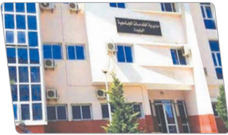
المركز لجامعة سعد دحلب في أقرب وقت، مطالبين بالتحقيق والمقارنة بين أرقام "الورقنة" ومؤشرات الرقمنة لاكتشاف العجب العجائب!

اصطف ممثلو الطلبة مع إصلاح الخدمات الجامعية، خاصة في شقة الأساسيات المتعلقة بفرض عمليات الرقمنة الشاملة في الاستفادة من الإطعام. وبهذا الصدد، نشر تنظيم "تحالف التجديد الطلابي الوطني"، عبر مكتبه الولائي لجامعة البليدة 1، منشورا على صفحته الرسمية بـ "الفيس بوك"، أشاد من خلاله بجهود مديرية الخدمات الجامعية الولائية، في تعميم الرقمنة بشكل سريع وفعال، مؤكداً أن أكبر فائدة لمشروع الرقمنة هي فضح الفساد والمفسدين المختبئين وراء "نظام الورقنة"، على حد تعبيره. وجاء موقف النقابية الطلابية على خلفية مناورات محلّية لمقاومة الإصلاح ومحاولات تعطيل العملية، لأجل الإبقاء على منافذ الفساد مفتوحة أمام من هبّ ودبّ لنهب قوت الطلبة. وأعرب التنظيم الطلابي عن شكره لوزير القطاع على "السياسة الرشيدة التي أخرجت الفئران من جحورها"، معتبراً "رقمنة الإطعام بمثابة ضربة موجعة لمن كان مستفيداً من الربح". وطالب ممثلو الطلبة بضرورة باستكمال رقمنة المطعم