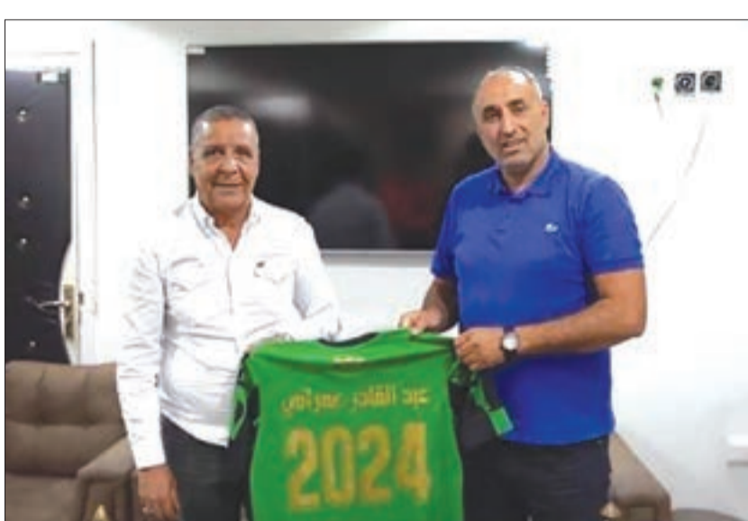
دريس ـ سن

وقال عمران، الذي تم تعيينه مدربا لثلاث سنوات، خلفا لليامين بوغرافه المستقيل من منصبه قبل قرابة عشرة أيام، عقب الخسارة أمام أولمبي الشلف، لحساب الجولة الثالثة من الرابطة المحترفة الأولى "موبيليس"، إنه قبل العرض الذي قدمه له عرامة في ظرف زمني وجيز، بالنظر إلى العلاقة الطويلة التي تربطه بالمدير الرياضي الجديد منهنيا، على اعتبار أنه سبق لهما العمل سويا، والتنوع ببطولة موسم 2017 - 2018 رفقة ذات الرجل يبقى شاهدا على ذلك.