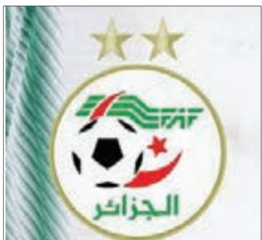
بضفونات أم إنها كانت عن قناعة. ط. بوزراب

صاحب المركز الأول عقب الجولات العشر من التصفيات إلى نهائيات كأس العالم 2026 التي ستعقد في الصومال