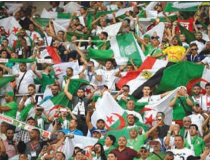
الجمهور، ابتداء من 10 نوفمبر. وكتبت الصاف في بيان لها على موقعها الرسمي ما يلي: تحييط الاتحادية الجزائرية لكرة القدم (فاف) علما، الرابطات وأندية كرة القدم عن الاستئناف التدريجي لكل النشاطات والمنافسات الكروية، ابتداء من يوم الجمعة 10 نوفمبر 2023. ويضيف نفس المصدر أن المقابلات ستجرى دون حضور الجمهور، وفق نفس الرزنامة المعتمدة للموسم 2023-2024، إلى غاية إشعار آخر، للتذكير، كانت الهيئة الكروية قد قررت يوم 18 أكتوبر الماضي، تعليق كل المنافسات ومباريات كرة القدم بملعب نيلسون ماندبلا ببراق، وكان الاتحاد الجزائري لكرة القدم قد أعلن أن منافسات كرة القدم المتوقفة منذ 18 أكتوبر تضامنا مع الشعب الفلسطيني ضحية العدوان الصهيوني الغاشم، وستقام مباريات البطولة الخامسة والاربعة للرابطة الثانية للهواة، يومي 10 و11 نوفمبر المقبل.

سبواحه الخضر خلال تصفيات كأس إفريقيا القادمة بكون ديفوار