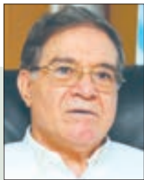
■ بشير فريك

مرت منذ أيام الذكرى الخامسة والثلاثون لإعلان القائد الرمز ياسر عرفات (أبو عمار) باسم الله وباسم الشعب الفلسطيني ونيابة عن المجلس الوطني للثورة الفلسطينية ومن قصر الأمم بناادي الصنوبر في الجزائر، قيام الدولة الفلسطينية وعاصمتها القدس الشريف، حدث ذلك في 15 نوفمبر 1988.