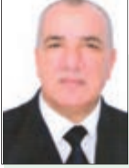
■ نورية نوار

الشيخ أبو اليقظان، واسمه الكامل هو: إبراهيم بن عيسى بن يحيى بن عيسى حمدي أبو اليقظان (الخامس نوفمبر 1888. الثلاثون مارس 1973م) سحابة ممطرة في سحاء غشت أرض الجزائر، ونبراس نشر ضيائه في أنفاس الأيام الجالجات التي مرت بها في فترة الاجتوم الثقيل للاستخبار الفرنسي على صدرها محاولا خنق أنفاسها، واجتثاث عناصر هويتها من جذورها، وابتلاعها لقمة هشّة سائغة، وتغيير سحناتها الوجودية الأصلية، واستبدالها بأخرى وافدة دخيلة.