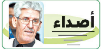
بقلم: أ. محمد الهادي الحسني