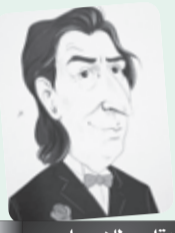
■ بقلم: طاهر حليسي