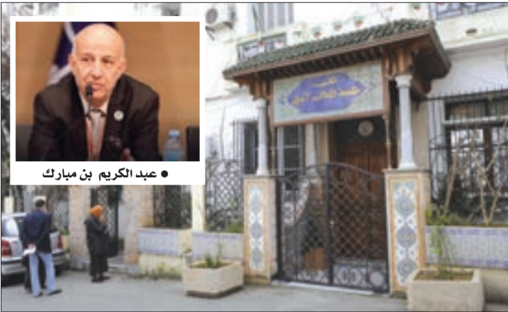
● عبد الكريم بن مبارك

يستعد حزب جبهة التحرير الوطني لعقد أول دورة للجنة المركزية في عهد الأمين العام المنتخب، عبد الكريم بن مبارك، يوم 7 جانفي المقبل، بقصر المؤتمرات "عبد اللطيف رحال"، وسيختار الوافد الجديد على رأس "الأفلاق" تشكيلة مكتبه السياسي التي ستراقفه طيلة المرحلة المقبلة.