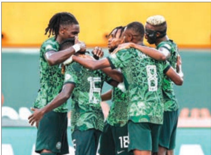
.. والكونغو الديمقراطية تهزم غينيا بثلاثية وتتأهل للمربع الذهبي