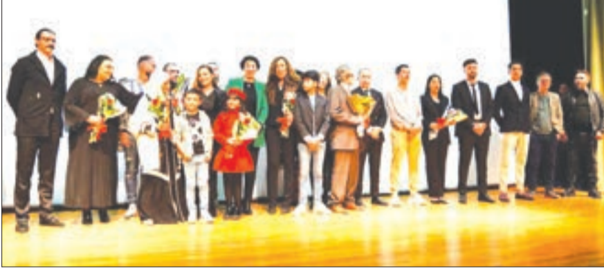
محمود بن شعبان

أعلنت وزيرة الثقافة والفنون، صورية مولوجي، خلال إشرافها أول أمس على العرض الشرفي الأول لفيلم "الطيارة الصفراء" للمخرجة هاجر سباطة بقاعة "ابن زيدون"، عن إطلاق مشروع سينمائي بعنوان "الجزائر بحب"، والذي سيشراف عليه المخرج الجزائري رشيد بلحاج، والمتمثل في إنتاج سبعة أفلام من إخراج مبدعات جزائريات تم انتقاؤهن من خلال مسابقة وطنية عبر الوطن، وذلك دعما لتواجد العنصر النسوي في السينما وخلق جيل جديد من المبدعات في المجال سواء السيناريو، الإخراج والإنتاج السينمائي.