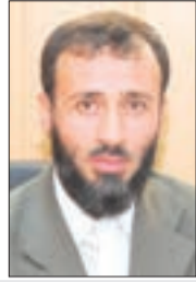
• سلطان بركاني

معلوم بالتواتر والاتفاق أن أركان الإسلام خمسة، لا تزيد ولا تنقص، وأولها الشهادتان وأخرها الحج على الرواية المشهورة، وهي ما يقوم عليه بنيان الإسلام من أعمال القلوب والجوارح ويجمع بين العبادات القلبية واللسانية والبدنية والمالية.. لكن كون الإسلام يبنى على خمسة أركان فقط لا يعني أنه ليس بين باقي شعائره ما يحظى بالأهمية البالغة، بل إن من شعائر الإسلام ما يداني الأركان الخمسة في أهميتها، ولذلك كثيراً ما نسمع من علماء الأمة حديثاً عن ركن الإسلام السادس، ومنهم من يتحدث عن الركن السابع، وهكذا!..