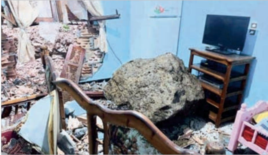
ع. تغمونت / ن. أوهاب

أدت الأمطار الغزيرة التي شهدتها ولاية بجاية طوال يومي الأربعاء والخميس، إلى ارتفاع منسوب وديان الولاية بشكل مخيف الأمر الذي أحدث طوارئ حقيقية لدى المواطنين ومختلف المصالح المعنية بالتدخل، علما أن مصالح الولاية قد لجأت إلى تنصيب خلية أزمة تزامنا مع وصول الاضطراب الجوي فيما تم تشكيل خلايا يقظة على مستوى البلديات والدوائر فيما نزال والي الولاية إلى الميدان من أجل متابعة مختلف التدخلات، الأمر الذي سمح بتجنب الكارثة.