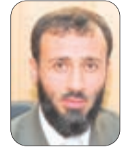
● سلطان بركاني

يروى في الآثار أن صحابي النبي -صلى الله عليه وسلم- سلمان الفارسي -رضي الله عنه- لما نزل المدائن في عهد الخلافة الراشدة، وسمع الناس بأن واحدا من الصحابة قد حل بديارهم، جعلوا يجتمعون حوله حتى كانوا نحوا من ألف. فافتتح سورة يوسف يقرأها، فجعلوا ينصرفون الواحد تلو الآخر، حتى لم يبق معه إلا نحو من مائة، ففضب وقال: أ الرخرف من القول أردتم، ثم ما قرأت كتاب الله عليكم ذهبتم؟!