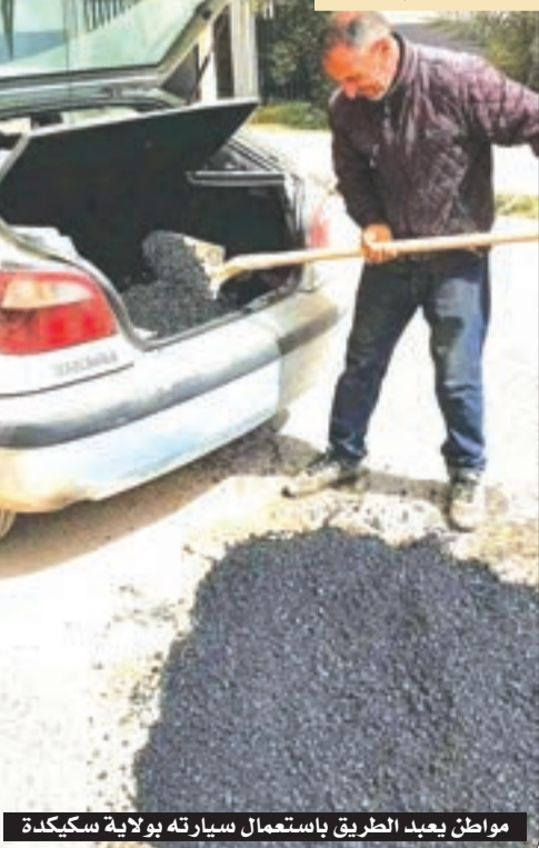
مواطن يعيد الطريق باستعمال سيارته بولاية سكيكدة