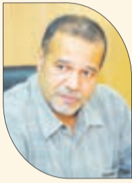
زبدي: تجار يستعملون أواني معدنية صدئة وبراميل زيوت التشحيم

من جهة أخرى، حذرت المنظمة الوطنية لحماية وإرشاد المستهلك من بعض الأنواع من الحلويات التي تباع خصيصا في شهر رمضان، نظرا لما تسببه من أضرار صحية بالغة على صحة المستهلكين، من بينها "الزلابية" التي أصبحت تحضر بأنواع مختلفة تجذب الزبائن مع بعض الإضافات، منها صلصة الشكولاتة وحلوى الشامية والمكسرات، كما أنها تطهى في الزيوت المحولة القديمة المستعملة للقلي، ويخلف هذا النوع من الحلويات بحسب المتحدث عدة أمراض منها الإصابة بارتفاع السكر في لاحتوائها