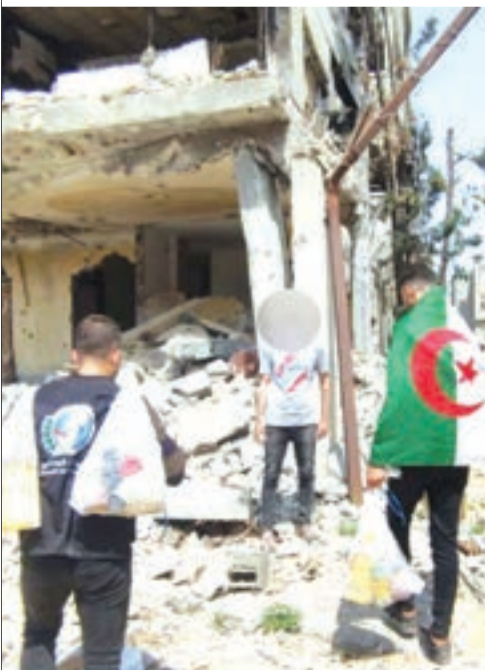
جمعية الايادي البيضاء تواصل توزيع قفة رمضان بغزة