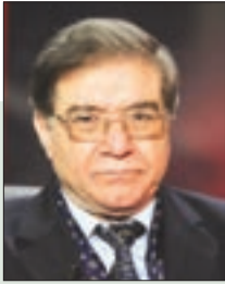
■ بشير فريك وال سابق و كاتب

” فقدت الجزائر، يوم الجمعة 12 أفريل الحالي، قامة من قاماتها الوطنية التضاللية الجهادية والعلمية الأكاديمية، إنه رائد جيش التحرير الوطني، طبيب الولاية التاريخية الثانية، خلال ثورة التحرير، وأحد مؤسسي كلية الطب بجامعة الجزائر. إنه المجاهد البروفيسور محمد التومي رحمه الله. ولأن الرجال يرحلون وتبقى مآثرهم، ويحكم معرفتي عن قرب للمرحوم منذ 25 سنة، ووفاء لروح الطاهرة، فقد آليت على نفسي أن أسجل هذه الكلمات في حقه، وإن كنت أعرف مسبقاً أنها لا ولن تفي بحقه أو التذكير بمسيرته التضاللية والجهادية في معركتي التحرير والبناء ..