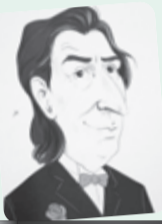
■ بقلم: طاهر حليسي