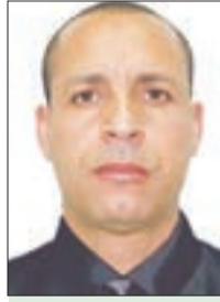
د / إسحاق شامير باحث في العلوم القانونية والاقتصادية

قال إسحاق شامير: (الجيل الحاضر تكفيه الحدود الحالية، والجيل القادم بحاجة إلى حدود أخرى، وإنه من الخطأ أن نوهم شبابنا أن سلا ما يمكن أن يكزس بيننا وبين العرب)، وقد كان شامير يتوقع دوما أن الصراع سيتواصل بين الجانبين، وهو ما يقند مزاعم إسرائيل في التعايش والسلام، فهنذا الإعلان عن وعد بلفور سنة 1917 والقاضي بزرع الكيان الصهيوني في قلب الأمة العربية، تصدت الدول العربية لهذا الاحتلال بسلسلة من الحروب بداية من سنة 1948، سنة 1956، حرب 1967، حرب أكتوبر 1973، غزو إسرائيل للبنان سنة 1982، انتفاضة سنة 1987.