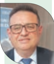
البروفسور نسيم نوري: الذكاء الاصطناعي شريك مهم في علاج السكري

ومعلوم، بحسب معطيات وزارة الصحة، أن مرضى السكري في الجزائر يقارب عددهم 2.8 مليون مصاب، مع توقع بلوغ عددهم، 5 ملايين مصاب مع حلول 2030.