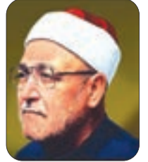
● بقلم: محمد الغزالي -رحمه الله-