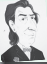
■ بقلم: طاهر حليسي