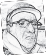
■ أعمار يزلي