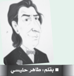
■ بقلم: طاهر حليسي