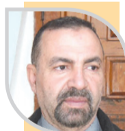
الشيخ جلول قسول

للإشارة فإن الاحتفال باليوم الوطني للكشافة الإسلامية الجزائرية، جاء بقرار رئاسي سنة 2021، في سياق تخليد مسار الحركة، كجزء من الذاكرة الوطنية، كونها تعمل منذ تأسيسها على غرس قيم حب الوطن لدى الناشئة وتعزيز روح العطاء