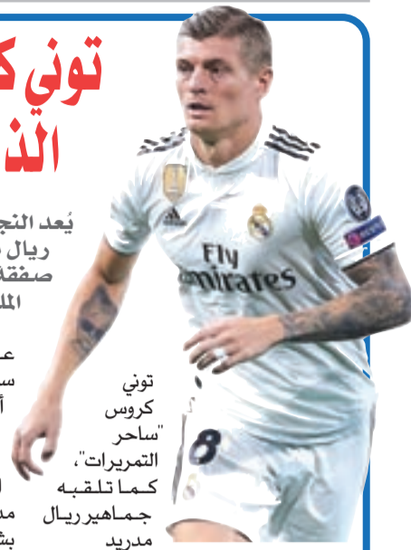
توني كروس "ساحر التمريرات"، كما تلقبه جماهير ريال مدريد

ويحمل توني كروس العديد من الألقاب في مسيرته، منها قيادته منتخب ألمانيا، إلى تحقيق لقب كأس العالم 2014، في البرازيل،