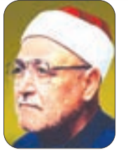
● بقلم: الشيخ محمد الغزالي - رحمه الله -