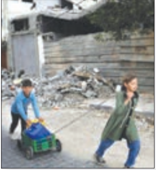
عبد السلام سكية / وكالات

قالت حركة حماس، إنه لم يتم تبليغها من قبل الوسطاء بشأن استئناف المفاوضات غير المباشرة مع الكيان الصهيوني حول صفقة تبادل أسرى ووقف الحرب، ووافقت دولة الاحتلال والولايات المتحدة وقطر ومصر على محاولة أخرى للوصول إلى صفقة تبادل للأسرى، رغم الاحتمالات الضعيفة، ومن المتوقع للمحادثات أن تجري في الأيام القليلة المقبلة في قطر.