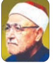
● بقلم: الشيخ محمد الغزالي - رحمه الله -

لم يجئ غلب اليهود علينا صدفة عارضة أو معجزة خارقة أو قدرا قاهرا. كلا، بل جاء نتيجة متسقة مع مقدماتها كما يجيء حاصل الجمع أو باقي الطرح صحيحا في حساب الأرقام. كان العكس - لو وقع - هو الأمر الذي يستحق التساؤل ويحتاج إلى ألف تفسير! وصحيح أن جمهور المسلمين خاض المعركة وهو واثق من كسبها، إنه في طوفان الخطب الرنانة والمقالات الحاملة لم يحسن تقدير شيء مما عند خصومه، بيد أن قوانين الكون لا تلين مع من يجهلها.