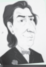
■ بقلم: طاهر حليسي