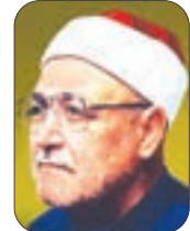
● بقلم: الشيخ محمد الغزالي - رحمه الله -