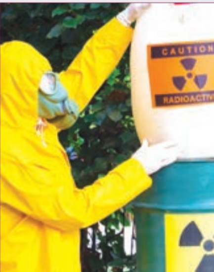
الأشغال العمومية في الجزائر ترفع وتيرة نقل المادة المشعة

نقل أسبوعي للمادة إلى مراكز العلاج النووي للسرطان