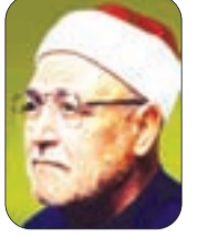
• الشيخ محمد الغزالي - رحمه الله -

لقد رأينا في تجاربنا مع الأيام أن الحق غريب مستوحش، فقد نحسب خدمة الحق لا تعدو تقريره، وكشف النقاب عنه. وهذا خطأ ضخم، فإن تثبيت الحق كإحياء جسم ما، أو إدارة آلة ما، لا بد له من جهود دائبة مضطردة، وإلا أذابه الباطل، وجرفه في تياره في القضايا الصغيرة، قد يحلف الشخص زورا، أن ما قاله صحيح، ليغتصب ما لا حراما، أو يستصدر حكما حائفا. وعلى ظهر الأرض كوف المحاكم لتعاقب هذه المغالطات، ومحاولة حراسة الحق.