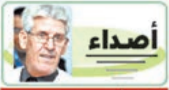
بقلم: أ. محمد الهادي الحسني