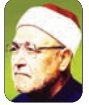
• الشيخ محمد الغزالي - رحمه الله -