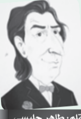
■ بقلم: طاهر حليسي

وما إن ركبنا السيارة وغادرنا المكان، حتى قلت لجاري: بغيت نسولك؟ علاش قلت للولد: مبروك عليك البيام والبيام؟ زوج مرات؟ علاه عاود فوتها؟ عنده زوج شهادت؟ ضحك وقال لي: البيام، والبيام دويلو في: اشترى له أبوه BMW بهذه المناسبة. حشمت، وأخرجت له 1000 دينار وأعطيتها له قائلا: شكرا، هذه المرة ما تخليكش تسال 3 أشهر.. كان عندي الدراهم بالزيادة في الجيب.. الله يكثر خيرك. الحمد لله كنت نسال الدراهم لواحد واعطاهم لي اليوم.