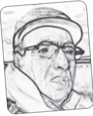
■ عمارة يزلي