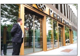
افتتاح الخيمس، بشكل رسمي، القرية الأولمبية المخصصة للورة الألعاب الأولمبية باريس 2024.

القرية الأولمبية تفتح أبوابها رسميا لوفود المشاركة