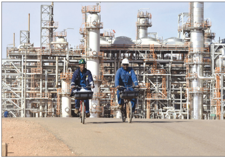
وفرة خام قطاع المعادن.. ومخزون إضافي للمواد الغذائية

أكد مسؤولو ومسيرة وزيدي من ثلث الشركات الصناعية في القطاعين العام والخاص لوجوههم إلى التمويل البنكي خلال الثلاثي الأول لسنة 2024 للدفع بنشاطاتهم الصناعية، معترفين بأنهم لم يجابهوا أي عراقيل في الحصول على هذا التمويل، في حين اشتكى هؤلاء من مشاكل في النقل وبعض الانقطاعات في التمويل بشبكة الكهرباء، كما شدد الصناعيون على عدم مجابهة أي مشاكل في التمويل بالماء، معربين عن رغبتهم في التوظيف وتجديد العتاد الصناعي.