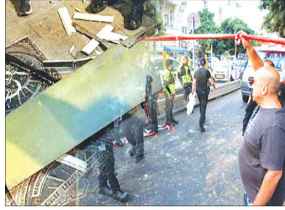
(إيلات)، أي بعد 7 أكتوبر 2023.

من جانبه، كشف مصدر يمني، أن الطائرة المسيّرة "يافا" التي استخدمتها القوات المسلحة اليمنية في استهداف "تل أبيب"، قد جرى تطويرها بعد اعتراض دول عربية للأسلحة اليمنية التي كانت تستهدف أم الرشراش