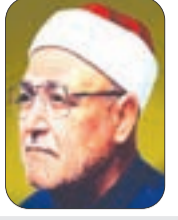
■ الشيخ محمد الغزالي - رحمه الله -