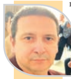
بواب ضياء الدين

بينما يشكّل المرضى المصابون بالنوع الثاني من السكري من النوع الثاني الأنسولين، فيشكلون بين 30 إلى 40 بالمائة من مرضى السكري.