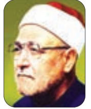
الشيخ محمد الغزالي - رحمه الله -