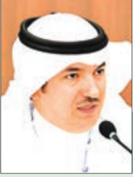
● د. محمد بن صقر السلمي رئيس المعهد الدولي للدراسات الإيرانية / الرياض