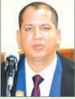
د / عبد الرؤوف مصطفى الغنيمي

استراتيجية" وليست "سياسة تكتيكية" على ضوء المراكز الدولية التي حصدتها المملكة، والأحداث العالمية التي ستستضيفها، والأهم تركيز المملكة في عهد الملك سلمان وعراب الرؤية ولي عهده سمو الأمير محمد بن سلمان على الأبعاد التنموية ومشروعات البنية التحتية والجوانب الاقتصادية لجذب الاستثمارات العالمية وتعزيز معدلات التجارة الدولية وتنفيذ المشاريع التنموية الواعدة للمملكة مثل نيوم ودلاين وصنع في السعودية والمناطق الاقتصادية الخاصة السعودية الخضراء والشرق الأوسط الأخضر، ففي أحد تصريحاته الشهيرة خلال أحد الجلسات في منتدى "مبادرة مستقبل الاستثمار" الذي انعقد في الرياض أكتوبر 2018م، صرح عراب المستقبل سمو الأمير محمد بن سلمان: "الشرق الأوسط هو أوروبا الجديدة، وأعتقد أن هذا الهدف سيحقق 100%، مستطرداً: "أنه لا يريد أن يفارق الحياة قبل أن يرى الشرق الأوسط متقدم عالمياً، وأن همة السعوديين مثل جبل طويق ولن تنكسر"، وفي يونيو 2023م، صرح سمو الأمير محمد عن مشروع نيوم قائلاً: "بلادنا تريد إنشاء حضارة جديدة للغد"، وأضاف: "نحتاج إلى تشجيع الدول الأخرى على الاستثمار في فعل نفس الشيء من أجل كوكب أفضل".