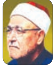
الشيخ محمد الغزالي - رحمه الله-