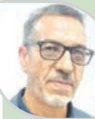
● المؤرخ بيتور: إبقاء الثورة في قلوب الشباب يحتاج إلى مناهج تعليمية ذكية

ويرى أن المدرسة الجزائرية تواجه تحديا كبيرا، لأنها أمام مسؤولية "تحيي" التاريخ للتلاميذ، وإبقاء الاهتمام والانجذاب إليه، رغم كل التغيرات الواقعة والتطورات السريعة في مجال الرقمية والتكنولوجيا، موضعا أن كل الأجيال الجزائرية تمر على التعليم المتوسط والثانوي، ومعناه أنها تدرس التاريخ وأحداث ثورة نوفمبر، ولكن لا يتوقف الأمر بحسبه، عند تحصيل النقاط عن مادة التاريخ دون الترسيع الجيد لإحداثه في اهتمامات الشباب ووجدانهم.