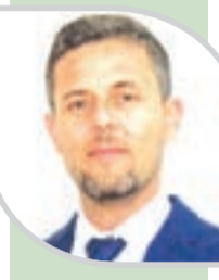
● دومير: صناعة المحتوى التاريخي رحلة ممتعة ومليئة بالتحديات

وقال إن علينا اليوم، أن نعرف كيف يمكن استعمال الذكاء الاصطناعي لإعداد محتويات تاريخية والتحضير للتحديات الجديدة، وكيف نثبت وجودنا، كما على الشباب والمؤرخين أن يواصلوا الاجتهاد في نشاطاتهم الخاصة بالمحتويات التاريخية. وأكد فرار أن الذكاء الاصطناعي يساعد الشباب الجزائري في تطوير منصات إلكترونية في مجالات مختلفة، أهمها الحديث عن الثورة الجزائرية وتجريم الاستعمار، وخاصة أن الوسائط الجديدة تساهم في اختصار الوقت، وخرق المسافات والوصول إلى أبعد نقاط من العالم.