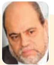
■ بقلم: أبو جزة سلطاني