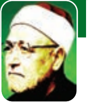
■ الشيخ محمد الغزالي - رحمه الله-