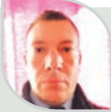
● صغيري: تراجع الإنتاج بسبب الجفاف وغرس مليون شجرة عام 2024

وبالنسبة لزيادة إقبال الجزائريين على زراعة الزيتون، أوضح محدثنا أن الأمر بات ملموسا في العديد من الولايات أين يتم التوسع في زراعة الزيتون بشكل كبير بالنسبة للعائلات وحتى للمستثمرين، خاصة مع استعمال تقنيات حديثة تساهم في زيادة مردود الشجرة الواحدة لأكثر من 25 لتر من الزيتون، وهذا ما جعل هذه الزراعة، بحسبه مريحة ومصدرا اقتصاديا للأشخاص وحتى للدولة، التي تسعى إلى تشجيع زراعة الزيتون وبلوغ مساحة مليون هكتار، سنة 2030، مؤكدا أن