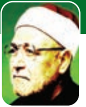
■ الشيخ محمد الغزالي - رحمه الله -