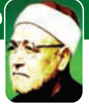
الشيخ محمد الغزالي - رحمه الله -