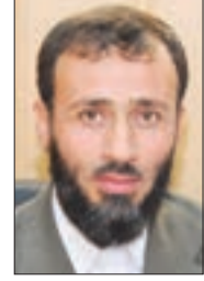
● سلطان بركاني

أيام قليلة، ونكون على موعد متجدد مع فصل الشتاء؛ فصل الخيرات والبركات، على ما فيه من الغسر والمضرات.. مهما أصاب العباد فيه من لسع البرد وصعوبة التنقل وتعسر الأعمال والأشغال وزيادة المصاريف، إلا أن الناس جميعاً يستبشرون فيه خيراً وهم يرون الأرض ترتوي حتى تسيل المياه على ظهرها وحتى تتفجر العيون وتمتلئ السدود.