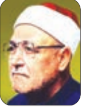
الشيخ: محمد الغزالي - رحمه الله -