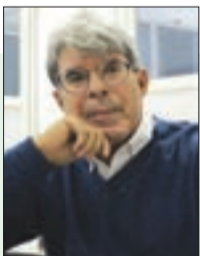
■ بقلم: أحمد راجعية

ماذا يمكن أن نقول اليوم عن مستقبل القضية الفلسطينية، وخاصة استمرار الإبادة الجماعية في غزة؟ الجواب هو أن إعادة انتخاب دونالد ترامب رئيساً للدولة الفيدرالية لا يبشر بالخير للشعب الفلسطيني، لأن ما يريده في الواقع الرئيس المنتخب هو توسيع "اتفاقيات إبراهيم" التي ترمي إلى تطبيع العلاقات بين الدولة الصهيونية والبلدان العربية في المنطقة، مما يؤدي في نهاية المطاف إلى محو فلسطين من الخريطة واستيعابها من قبل الدولة الصهيونية. ترامب، الذي لا يخفي تعاطفه القوي مع إسرائيل، يدعم أكثر من أي وقت مضى أنصار ضم الضفة الغربية.