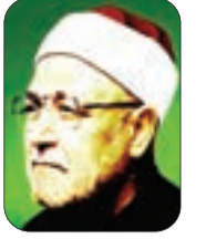
الشيخ: محمد الغزالي - رحمه الله -