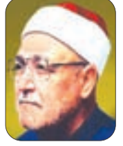
■ الشيخ محمد الغزالي - رحمه الله -