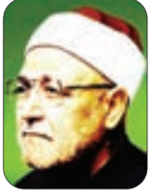
■ الشيخ: محمد الغزالي - رحمه الله -