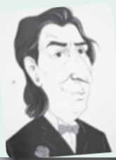
■ بقلم: طاهر حليسي