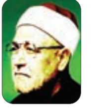
الشيخ: محمد الغزالي - رحمه الله -