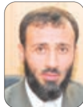
● بقلم: سلطان بركاني

تداول مختلف وسائل الإعلام ووسائل التواصل الاجتماعي، أواخر كل عام ميلادي إحصاءات مفزعة تتعلق بواقع الأسرة في الدول العربية، تشير بعضها إلى أنه يتم تسجيل عشرات الآلاف من حالات الخلع في العام الواحد في البلد الواحد، وهو رقم هائل ومفزع، يدعو إلى القلق على مستقبل الأسر المسلمة، ويحث على الأئمة والدعاة ورجال الإعلام أن يعلنوا حالة الاستنفار لتدارك ما يمكن تداركه.