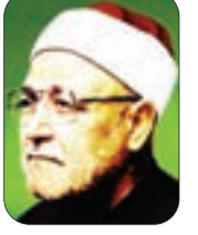
■ الشيخ: محمد الغزالي - رحمه الله -