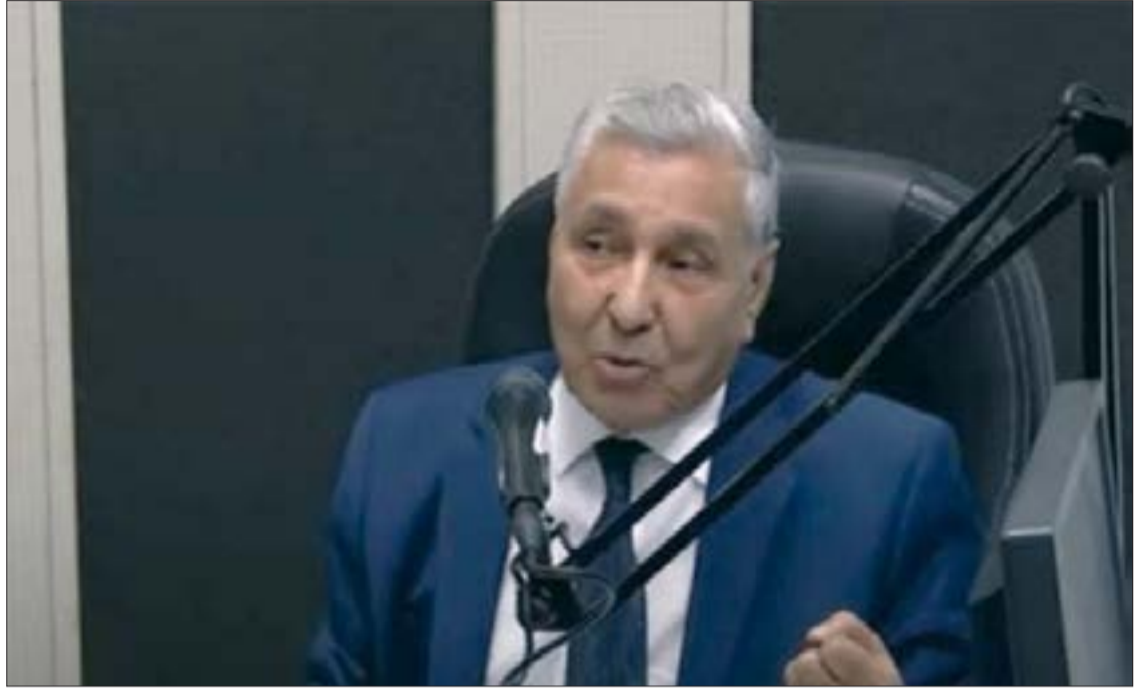
لوز محمد أمين

حلّ صبيحة أول أمس، الثلاثاء، رئيس المجلس الوطني لحقوق الإنسان السيد عبد المجيد زعلاني بولاية تيارت، وكانت له زيارة لساحة الشهداء بوسط مدينة تيارت، استحضّر من خلالها، تضحيات الشهداء، وذكر بمسيرة الفنان الرمز الشهيد علي معاشي في سبيل استقلال الجزائر، وأكد أنه كان يتمتع بموهبة موسيقية عالية استغلها في الدفاع عن القيم السامية وإبراز مقومات الشخصية الوطنية، فعمله الفني «أنغام الجزائر» عرف بالجزائر لأنه يشيد بكل المناطق الجزائرية.