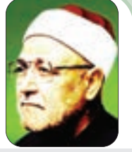
الشيخ: محمد الغزالي - رحمه الله -